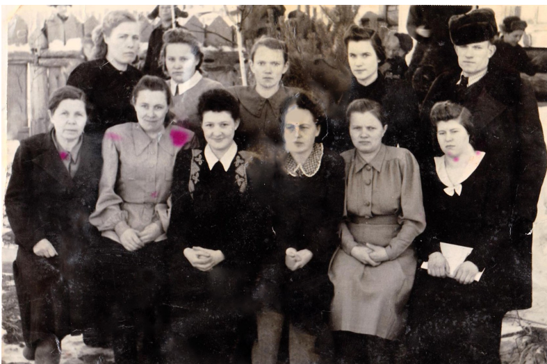
КОЛЛЕКТИВ УЧИТЕЛЕЙ ЮГОВСКОЙ ШКОЛЫ