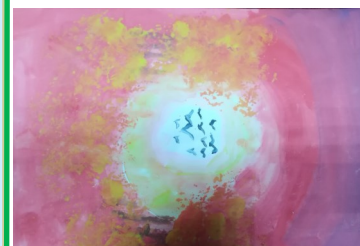
Нилов Д., 2 класс