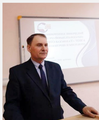
Директор МОУ «Таловская СОШ»

В муниципальных образовательных организациях работает более 900 работников.