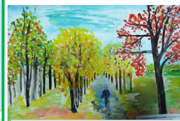
Сафронов К., 10 кл.