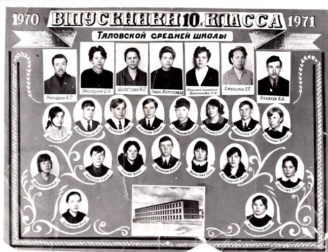
Первый выпуск в новом здании школы