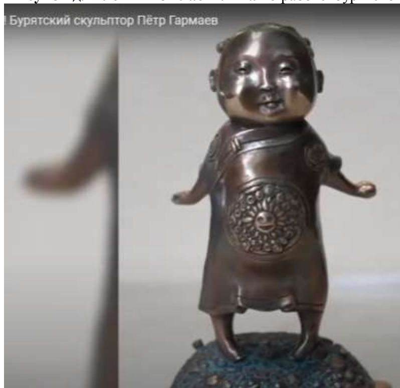
Рисунок для лепки из пластилина по работе бурятского скульптора Петра Гармаева