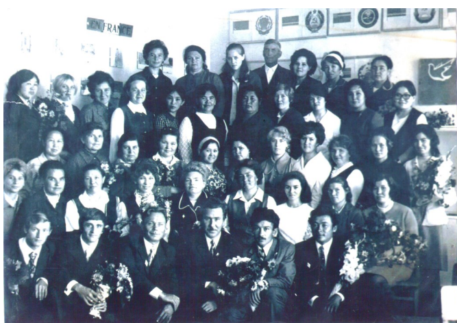
Коллектив учителей Таловской школы