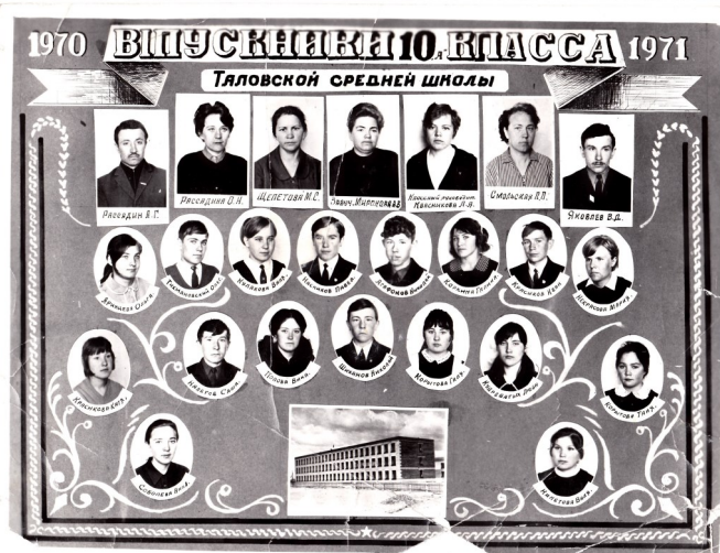
Первый выпуск в новом здании школы