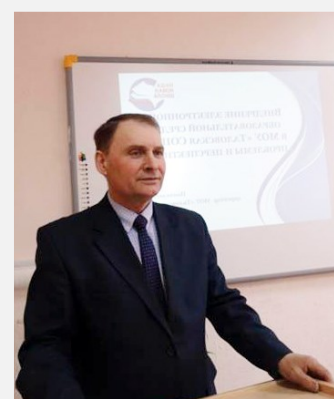
Директор МОУ «Таловская СОШ»

С 2003 года избиратели оказывали ему постоянное доверие, избирая депутатом районного Совета народных депутатов. Под его руководством реализованы проекты школьников и педагогов, направленные на улучшение жизни местного сообщества.