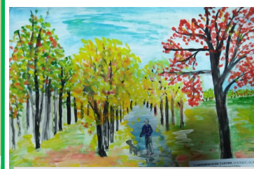
Сафронов К., 10 кл.