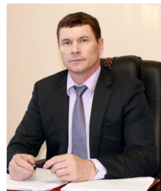
Глава МО «Прибайкальский район»

Прибайкальский район – красивейший и богатейший край, раскинувшийся около берегов величавого сибирского озера. И пусть невелика наша точка на карте, но значима в жизни республики и страны. Сегодня наше Прибайкалье – это край с развитой инфраструктурой, сетью автомобильных и железных дорог.